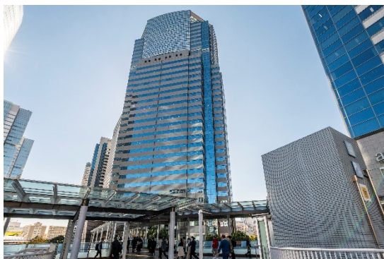
▲『品川営業所』のあるイーストワンタワー外観

この度の出店により、三菱地所ハウスネットの営業拠点は、全国38カ所、首都圏23カ所となります。引き続き積極的な店舗展開を行うとともに、「三菱地所の住まいリレー」ブランドの下、売買仲介、賃貸仲介・管理部門が相互に連携し、社会の変化と時代の流れとともに、住まいに関する<売りたい・買いたい・貸したい・借りたい>にお応えできるよう事業を展開してまいります。