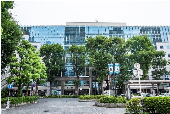
▲『武蔵小杉営業所』のある武蔵小杉 STMビル