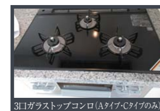
3口ガラストップコンロ (Aタイプ・Cタイプのみ)