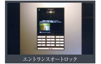
エントランスオートロック