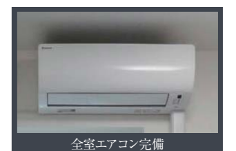
全室エアコン完備