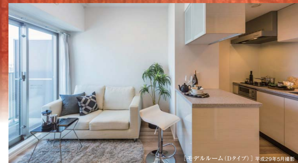
[モデルルーム(Dタイプ)] 平成29年5月撮影

古くは寛永の時代より永代寺の門前町として栄えてきた「門前仲町」。現代でも当時の賑わいの雰囲気を色濃く残し、東京江戸三大祭のひとつ深川八幡祭りをはじめ活気あふれるエリアです。「トラディティオ門前仲町」は、そんな門前仲町駅より徒歩1分の好アクセスを誇ります。