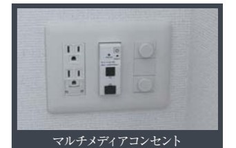
マルチメディアコンセント

※掲載の室内写真及び設備写真は現地モデルルームを撮影したものです (平成29年5月)。家具・調度品等は賃貸対象に含まれません。住戸タイプにより一部仕様が異なります。詳細はお問い合わせください。