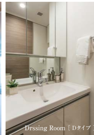
Dressing Room [Dタイプ]