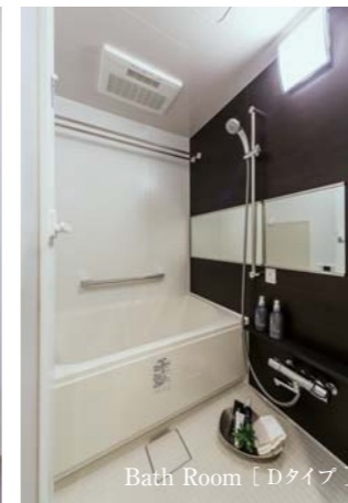
Bath Room [Dタイプ]