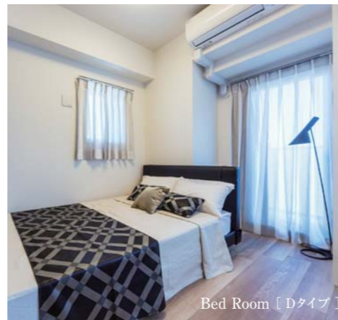
Bed Room [Dタイプ]