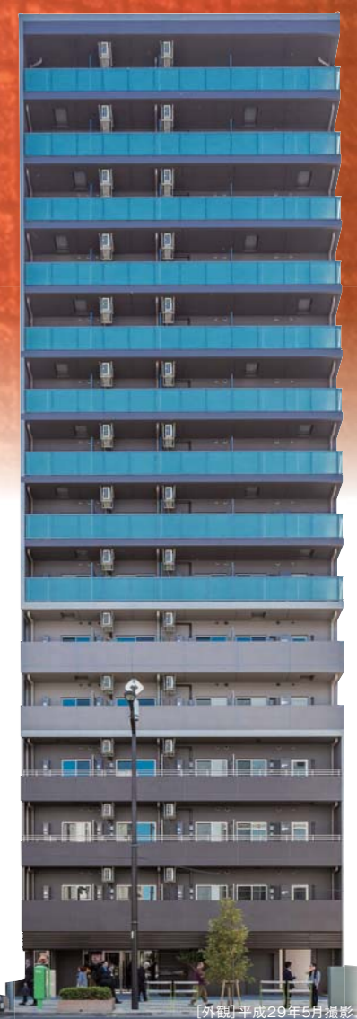
[外観] 平成29年5月撮影

www.mec-h.com/building/td_monzen-nakacho