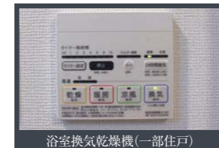
浴室換気乾燥機 (一部住戸)