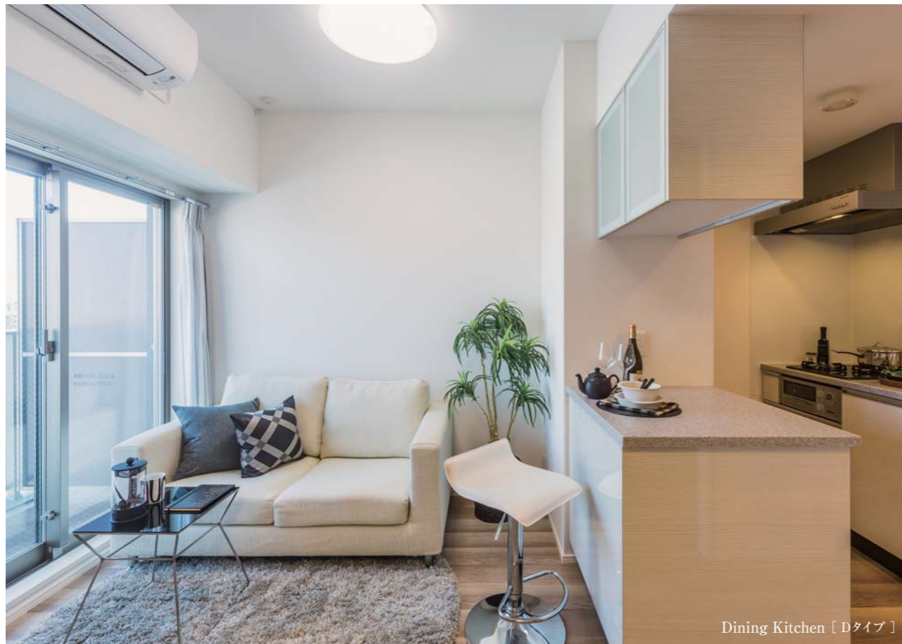
Dining Kitchen [Dタイプ]