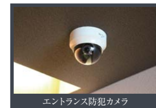
エントランス防犯カメラ