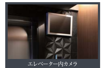
エレベーター内カメラ